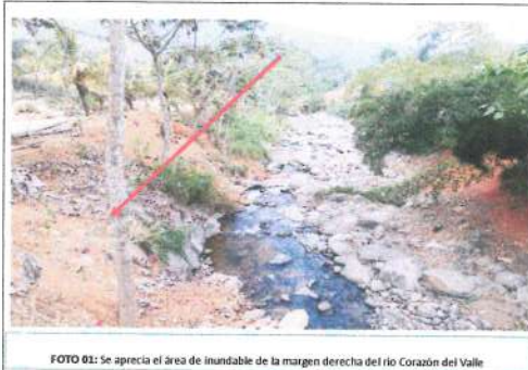
FOTO 01: Se aprecia el área de inundable de la margen derecha del río Corazón del Valle