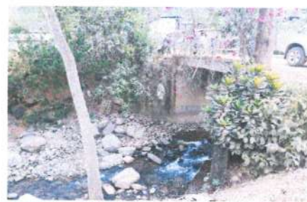
FOTO 02: Se aprecia el puente Corazón del Valle de estructura concreto armado que es erosionado en las épocas de avenida del río Corazón del Valle.